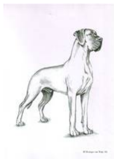
Diese Illustration stellt nicht unbedingt das Idealbild der Rasse dar

Auf unserer Hauptversammlung 2009 wurden einige Standardänderungen beschlossen. Diese wurden über den VDH an die FCI zur Genehmigung weitergeleitet. Hierbei mussten Vorgaben der FCI, die Gesundheit unserer Deutschen Dogge betreffend mit eingearbeitet werden.